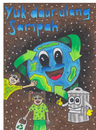
JUARA 5 POSTER HARI SAMPAH HC SHAFFA DALIHZ (VIIIA)

“Ya Allah, perbaikilah agamaku karena ia merupakan pangkal urusanku, perbaikilah duniaku yang di dalamnya penghidupanku, perbaikilah akhiratku karena ia tempat kembaliku, dan jadikanlah hidup ini kesempatan bagiku untuk menambah kebaikan, dan jadikanlah mati sebagai pelepas diriku dari setiap kejahatan” (HR Muslim).