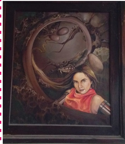
Salah satu lukisan karya Pak Wid

BANGGALAH PADA DIRI SENDIRI, MESKI ADA YANG TAK MENYUKAI. KADANG MEREKA MEMBENCI KARENA MEREKA TAK MAMPU MENJADI SEPERTI DIRIMU